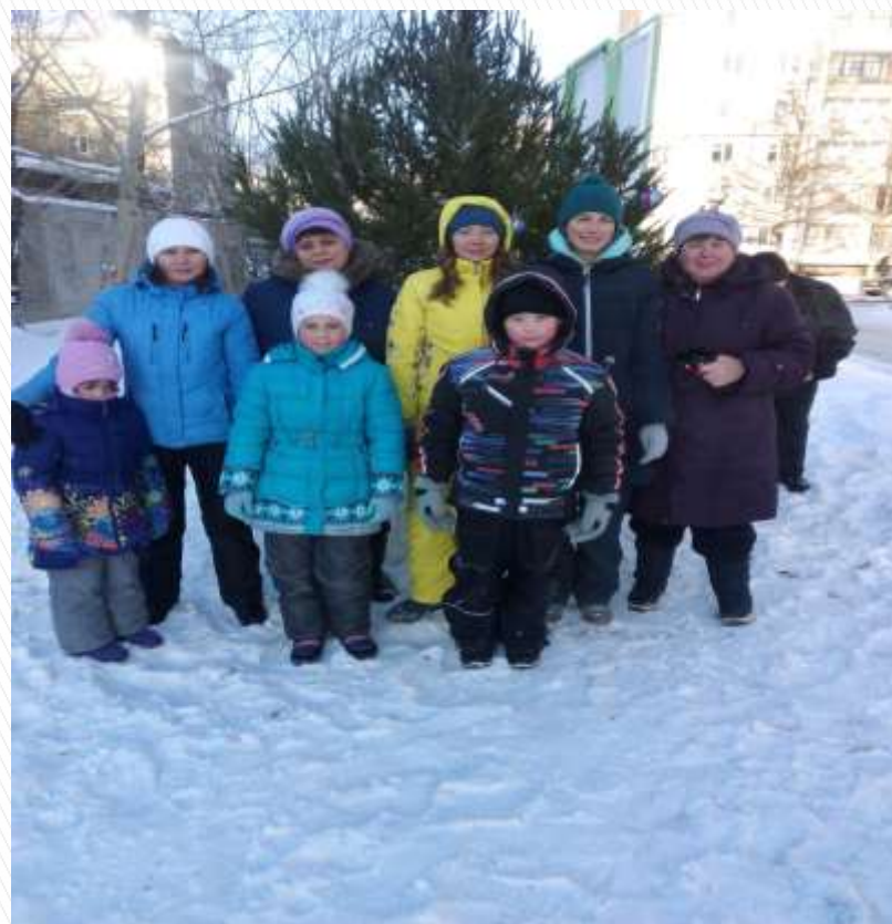
Фото на память!

40 градусом мороз не помеха, когда дружный коллектив!